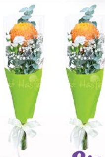
208-12-08 Hoa Mix Hạnh Phúc S 85.000 đ/bó