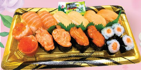
SUSHI SET NGƯỜI YÊU CÁ HỒI ĐẶC BIỆT