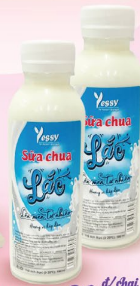
SỮA CHUA LÁC YESSY 250ML