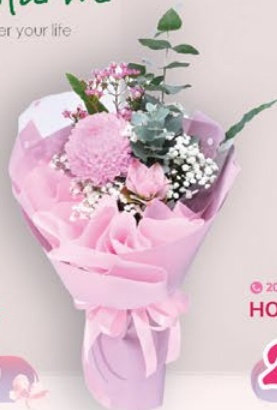
208-12-05 HOA MIX BÌNH AN S 175.000 đ/bó