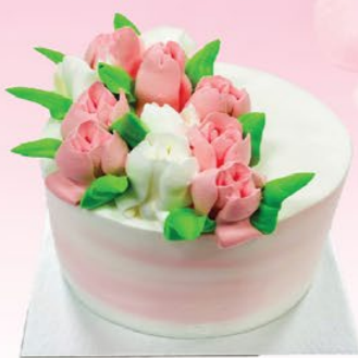
208-12-02 BÁNH KEM AEON MINI (WOMEN DAY) 39.200 đ/cái