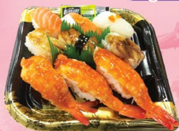
SUSHI SET OKI EBI