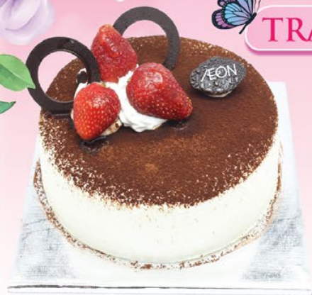
208-12-01 TIRAMISU Ồ TRÒN 196.300 đ/cái