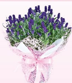
208-12-12 Chậu Lavender Gói 165.000 đ/chậu