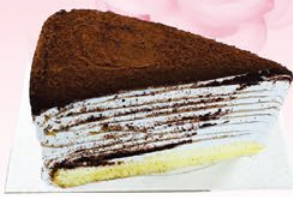
208-12-03 CREPE TIRAMISU CHẤM KHANG 80G 22.000 đ/phần 25.500