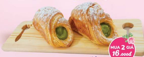
DANISH KEM TRÀ XANH