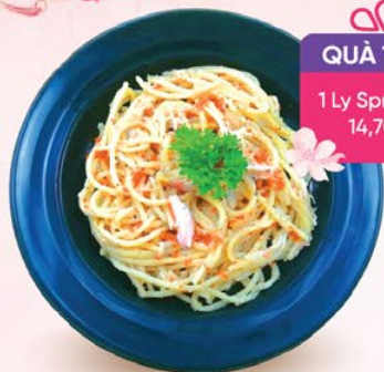
MÌ Ý SỐT VỊ CUA