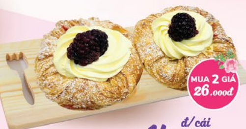
DANISH MÂM XÔI ĐEN