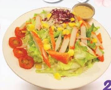
SALAD THANH CUA