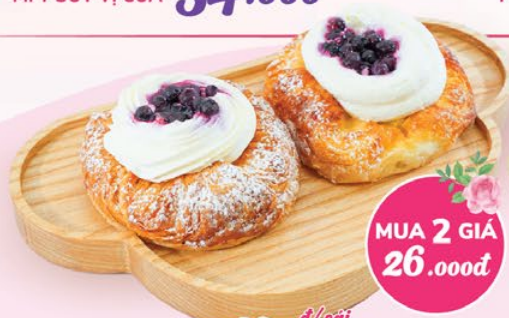
DANISH VIỆT QUẤT