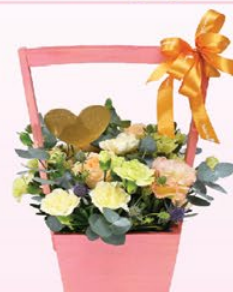
208-12-13 Bó Hoa Nụ Cười Việt L 205.000 đ/giỏ