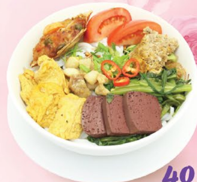
CANH BÚN ĐẶC BIỆT