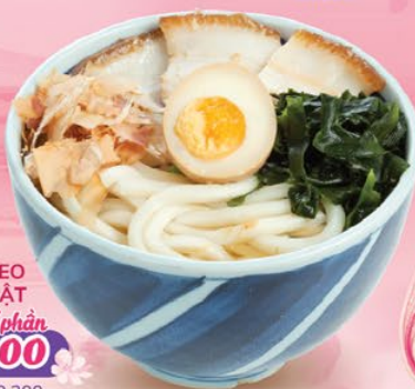
UDON THỊT HEO HÂM KIỂU NHẬT