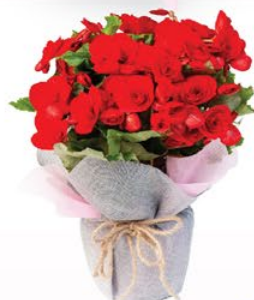
208-12-10 Chậu Thu Hải Đường Gói 135.000 đ/chậu