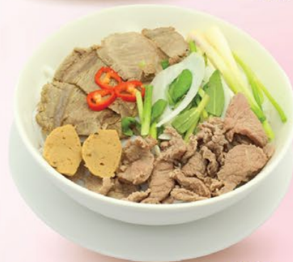
PHỞ AEON ĐẶC BIỆT