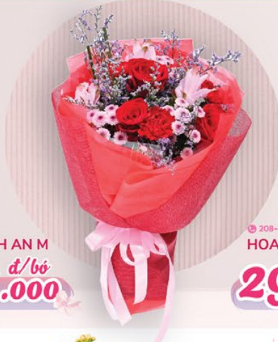
208-12-06 HOA MIX BÌNH AN M 205.000 đ/bó