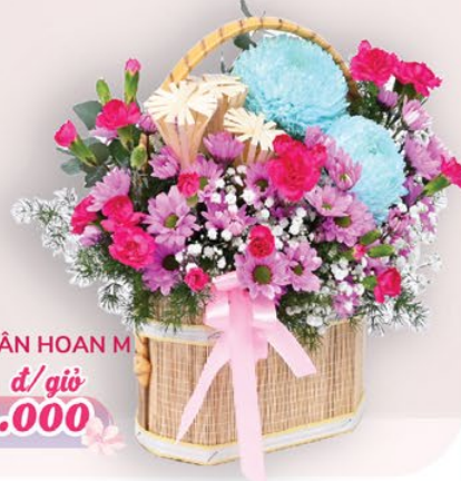
208-12-07 HOA MIX HÂN HOAN M 299.000 đ/giỏ