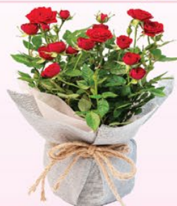
208-12-11 Chậu Hoa Hồng Gói 165.000 đ/giỏ