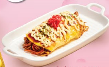
MÌ XÀO OMUSOBA