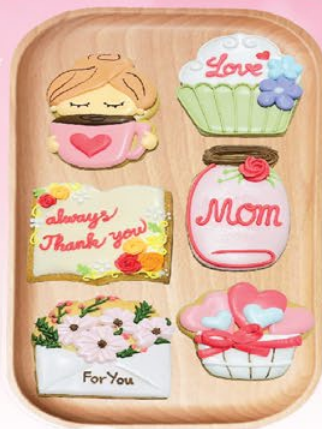
208-12-04 COOKIE WOMEN DAY 32.000 đ/cái