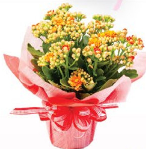
208-12-09 Chậu Sống Đời TK Gói 125.000 đ/chậu